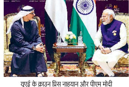
नई दिल्ली

राष्ट्रीय राजधानी नई दिल्ली में आयोजित एआई इंपैक्ट समिट 2026 के बीच भारत-यूआई संबंधों को नई मजबूती मिली। समिट में हिस्सा लेने पहुंचे अरबू धाबी के क्राउन प्रिंस शेख खालिद बिन मोहम्मद बिन जायद अल नाहयान ने गुरुवार को पीएम नरेंद्र मोदी से द्विपक्षीय मुलाकात की। इस बैठक में उन्नत तकनीक, कृत्रिम बुद्धिमत्ता और रणनीतिक सहयोग को और गहरा करने पर चर्चा हुई। इस बात की जानकारी विदेश मंत्रालय के प्रवक्ता रणधीर जायसवाल ने दी। अरबू धाबी के क्राउन प्रिंस बुधवार को दिल्ली पहुंचे थे। विदेश मंत्रालय के प्रवक्ता रणधीर जायसवाल ने बताया कि भारत और यूआई भरोसेमंद साझेदार हैं और उन्नत तकनीक, खासकर आर्टिफिशियल इंटेलिजेंस (एआई) के क्षेत्र में मिलकर काम कर रहे हैं। उन्होंने सोशल मीडिया प्लेटफॉर्म एक्स पर लिखा कि क्राउन प्रिंस का एआई इंपैक्ट समिट में स्वागत है और भारत-यूआई मिलकर बेहतर और साझा भविष्य के लिए एआई को आगे बढ़ा रहे हैं। भारत-यूआई संबंधों की नींव रखने वाले ऐतिहासिक संबंधों को याद करते हुए, दोनों नेताओं ने द्विपक्षीय सहयोग पर चर्चा की और विभिन्न क्षेत्रों में हासिल की गई प्रगति पर संतोष व्यक्त किया। उन्होंने एआई में सहयोग बढ़ाने के तरीकों पर भी चर्चा की।