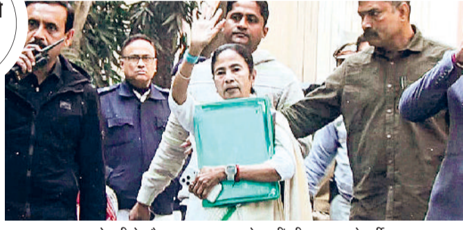
छापेमारी के दौरान खास फाइल ले जाती सीएम ममता बेनर्जी

प्रभाव, पावर और जेड प्लस सिक्वॉरिटी का गलत इस्तेमाल किया