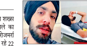
उनकी जिम के बाहर कथित नस्लीय हमले में हमला हुआ जिससे उनकी नाक टूट गई और उन्हें गहरा मानसिक आघात