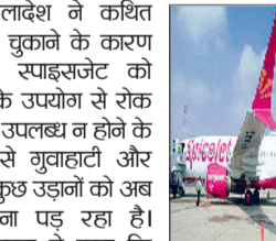
एयरलाइन प्राधिकरणों के साथ कोविडेशन शुरू करने में संचालन और प्रक्रियागत मुद्दों पर चर्चा कर रही है। नियमित संचालन में है। उन्होंने इसे उद्योग से जुड़े सामग्य मुद्दे बताते हुए कहा कि जल्द संधान की दिशा में रचनात्मक तरीके से काम किया जा रहा है और निर्धारित उड़ान सेवाएं नियमों के अनुसार जारी हैं।