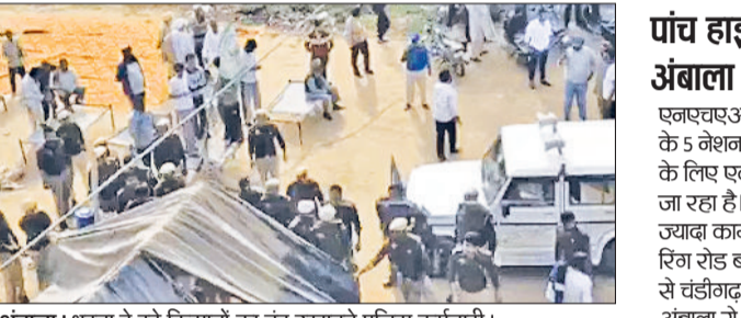
अंबाला। धरना दे रहे किसानों का तंबू उखाड़ते पुलिस कर्मचारी।